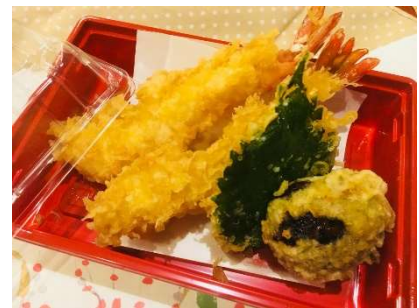
注文No.3 天ぷら別売り 480 円 (税込)

精進料理 手打そば 瀧本店 TEL 0562-95-3101 FAX 0562-95-3102