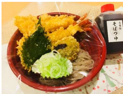
注文No.2 天ぷらそば 汁と薬味付き 1 人前 1,080 円 (税込)