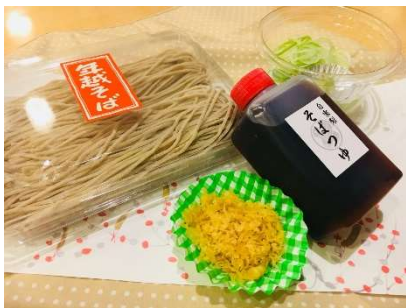
注文No.1 生そば 汁と薬味付き 2 人前 1,080 円 (税込)